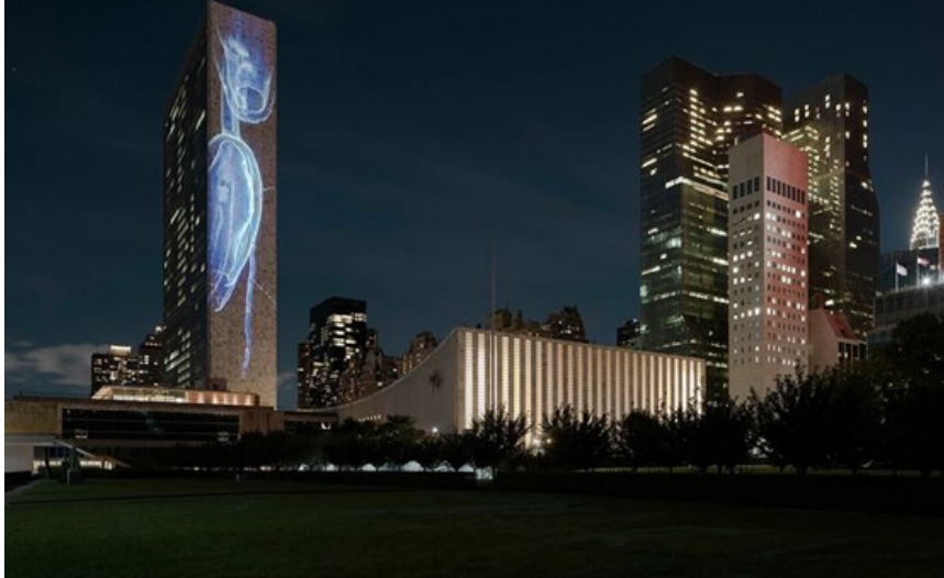
Vertical Migration is commissioned by ART 2030 and TBA21-Academy, and supported by Avatar Alliance Foundation, Dalio Philanthropies, OceanX, Woods Hole Oceanographic Institute (WHOI), New Carlsberg Foundation, The Obel Family Foundation, Beckett Fonden, and Danish Arts Foundation. Vertical Migration was developed in close collaboration with Kollision. Vertical Migration is part of 'Interspecies Assembly' by SUPERFLEX for ART 2030.