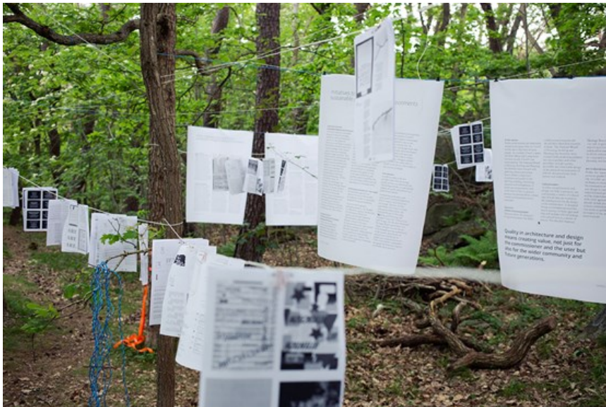
Bild: Illustration, gestaltad livsmiljö, HDK, foto: John Wattström.

RAIN GOTHENBURG är en jubileumssatsning i Göteborg som utgår från regn och människa. Med en kreativ process vill man förändra såväl inställning till regn som hur samhället utformas. Visionen är att bli Världens bästa stad när det regnar.